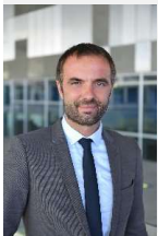
Michaël DELAFOSSE, Maire de la Ville de Montpellier, Président de Montpellier Méditerranée Métropole

Cet aménagement fait partie du Réseau Express Vélo que nous sommes en train de construire. À l'image du futur réseau structurant en transports collectifs (constitué des deux lignes de TER, des 5 lignes de tramways et des 5 lignes de busstram), il sera un réseau cyclable continu, sécurisé et confortable de 235 km. Il reliera les cœurs de village des communes au cœur de la Métropole jusqu'à la place de la Comédie, mais aussi les communes du territoire entre elles.