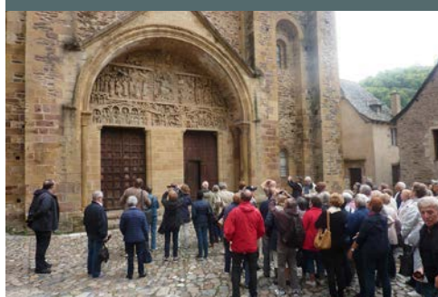
Voyage des aînés à Conques et Aubin organisé par la municipalité, les 18 et 25 septembre