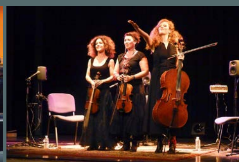
Saison culturelle - Concert Trio zéphyr organisé par la municipalité, le 3 octobre