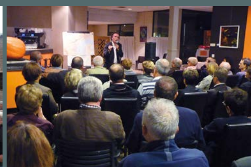
Pause culturelle organisée avec le concours de la municipalité, le 2 octobre