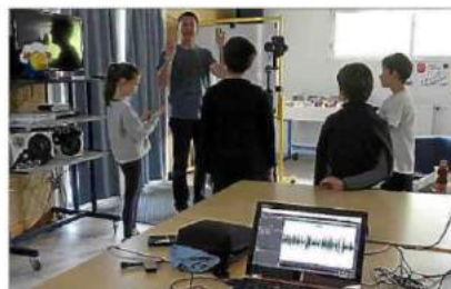
■ Les jeunes du centre de loisirs initiés à la technique.

► D'autres infos sur www.feel.u , nosmemoiresvives.fr , et zoomomez.fr .